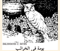
يومة في الخراب

بِدُمُوعِي، 10 بِسَبِّ غَضَبِكَ الشَّدِيدِ، لِأَنَّكَ رَفَعْتَنِي وَرَمَيْتَنِي بِعُنْفٍ. 11 أَيَّامِي تَزُولُ كَظَلٍّ فِي آخِرِ النَّهَارِ، أَنَا بَيْسْتُ كَالْعُشْبِ.