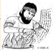
يقطعها بسكين ويحرقها

36:30 هجم ملك بابل على القدس، وأخذ ملكها يوياقيم أسيرا مقيدا بسلاسل إلى بابل (2خ 7:36).