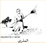
HK00097B © BFBIS المذرى