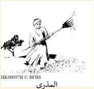
HK00097B © BFBIS المذرى