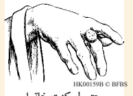
حتى لو كنت خاتما

23:22 قصر لُبْنَانَ، أي القصر الملكي الذي بناه سليمان في القدس (1مل 7:2) والحديث موجه هنا إلى الملك يوياكين (2أف).