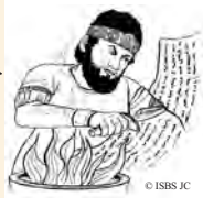
يقطعها بسكين ويحرقها

36:30 هجم ملك بابل على القدس، وأخذ ملكها يوياقيم أسيرا مقيدا بسلاسل إلى بابل (2خ 36:7-5).