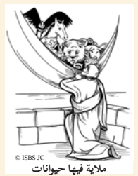
ملابية فيها حيوانات