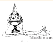
مجمرة HK00268B

1:10 المجمرة يوضع فيها الجمر مع البخور. 2:10 عد 35:16 عد 2:10