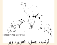
أرنب، جمل، خنزير، وبر