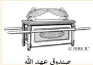
صدوق عهد الله

16 ثُمَّ أَدْخَلُوا صُنْدُوقَ الْعَهْدِ، وَأَقَامُوهُ فِي وَسَطِ الْخَيْمَةِ الَّتِي نَصَبَهَا لَهُ دَاوُدُ. وَقَدَّمُوا قَرَابِينَ وَضَحَايَا صُحْبَةَ آتَمَامِ اللَّهِ. 2 وَلَمَّا انْتَهَى دَاوُدُ مِنْ تَقْدِيمِ الْقَرَابِينِ وَضَحَايَا الصُّحْبَةِ، بَارَكَ الشَّعْبُ بِاسْمِ اللَّهِ. 3 وَوُزِعَ عَلَى كُلِّ وَاحِدٍ مِنْ بَنِي إِسْرَائِيلَ، مِنْ رِجَالٍ وَنِسَاءٍ، رَغِيْفٌ خُبْزٍ وَكَأْسٌ بَيْدٍ وَقُرْصٌ زَيْبٍ.