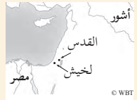
ستنحريب يهدد القدس

26 فَقَالَ الْيَاقِيمُ ابْنُ حَلْقِيَا وَشَبَنَةُ وَيُوَآخَ لِقَائِدِ الْحَيْشِ: "مِنْ فَضْلِكَ، كَلِّمْ عِبِيدَكَ بِاللُّغَةِ الْأَرَامِيَّةِ لِأَنَّنا نَفْهَمُهَا، وَلَا تَكَلِّمْنَا بِالْعِبْرِيَّةِ بِمَسْمَعٍ مِنَ الشَّعْبِ الَّذِي تَجَمَّعَ عَلَى السُّورِ." 27 فَقَالَ الْقَائِدُ: