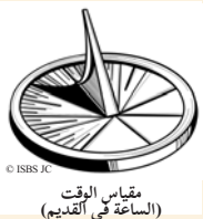
© ISBS JC مقياس الوقت (الساعة في القديم)

20 وَبَقِيَّةُ أَخْبَارِ حَزَقِيَّا، وَكُلُّ انْتِصَارَاتِهِ، وَكَيْفَ عَمِلَ الْبِرَّةَ وَالْقَنَاءَةَ وَأَدْخَلَ الْمَاءَ إِلَى الْمَدِينَةِ، هِيَ مَكْتُوبَةٌ فِي كِتَابِ أَخْبَارِ مَلُوكِ يَهُودَا. 21 وَأَنْضَمَّ حَزَقِيَّا إِلَى أَسْلَافِهِ، وَمَلَكَ مَدَسَى ابْنُهُ مَكَانَهُ.