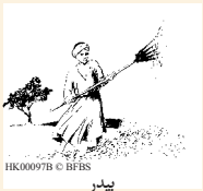
HK00097B بيدري

18 فِي ذَلِكَ الْيَوْمِ ذَهَبَ جَادُ إِلَى دَاوُدَ وَقَالَ لَهُ: "إِصْعَدْ إِلَى بَيْدَرِ أَرُونَةَ الْبُيُوسِيِّ، وَأَقِمْ هُنَاكَ مَنَصَّةَ قُرْبَانَ لِلْمَوْلَى." 19 فَصَعِدَ دَاوُدُ كَمَا أَمَرَهُ اللَّهُ بِوَسِيطَةِ جَادَ. 20 وَلَمَّا رَأَى أَرُونَةَ الْمَلِكَ وَرِجَالَهُ قَادِمِينَ إِلَيْهِ، خَرَجَ وَانْحَنَى لِلْمَلِكِ بِوَجْهِهِ نَحْوَ الْأَرْضِ. 21 وَقَالَ أَرُونَةُ: "لِمَاذَا جَاءَ سَيِّدِي الْمَلِكُ إِلَى عَبْدِي؟" فَقَالَ دَاوُدُ: "لِأَسْتَرِي مِنْكَ الْبَيْدَرَ، لِكَيْ أَقِيمَ فِيهِ مَنَصَّةَ لِلْمَوْلَى، فَيَتَوَقَّفَ الْوَبَأُ عَنِ الشَّعْبِ." 22 فَقَالَ أَرُونَةُ لِدَاوُدَ: "بَلْ خُذْهُ يَا سَيِّدِي الْمَلِكُ، وَقَدِّمْ لِلْمَوْلَى مَا يَخْلُو لَكَ. أَنْظُرْ! أَنَا أُعْطِيَ الْبَقْرَ لِيَكُونَ قُرْبَانًا، وَالْتَوَارِجَ وَأَنْبَارَ الْبَقْرِ لِيَتَكُونَ حَطَبًا. 23 أَيُّهَا الْمَلِكُ، أَرُونَةُ يَقَدِّمُ كُلَّ هَذَا لِلْمَلِكِ." وَقَالَ أَرُونَةُ لَهُ أَيْضًا: "الْمَوْلَى إِلَيْكَ يَرْضَى عَنْكَ." 24 فَقَالَ الْمَلِكُ لِأَرُونَةَ: "لَا، بَلْ أَدْفَعُ لَكَ الثَّمَنَ. فَأَنَا لَا أَقْدِمُ لِلْمَوْلَى إِلَهِي قُرْبَانًا لَا يَكْفُلُنِي شَيْئًا." فَاسْتَرَى دَاوُدُ الْبَيْدَرَ وَالْبَقْرَ 600 جِرَامٍ مِنَ الْفِضَّةِ. 25 وَبَنَى دَاوُدُ هُنَاكَ مَنَصَّةَ لِلْمَوْلَى، وَقَدَّمَ قُرَابِينَ وَضَحَايَا صُحْبَةٍ. فَاسْتَجَابَ اللَّهُ مِنْ أَجْلِ الْبِلَادِ، وَتَوَقَّفَ الْوَبَأُ عَنِ إِسْرَائِيلَ.