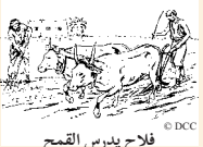
فلاح يدرس الفمخ

10:7-4 11:1 5-1:25 24:11 23:25 18:5 14:25 1كور 9:9 9:1 24:22 5:25 8:38 3:38 19:12 20:2